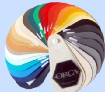
Orca® gumirano platno

2. obnova podvodnega dela 3. obnova nadvodnega dela