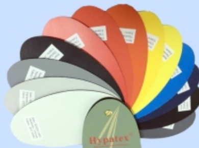
Hypatex® gumirano platno