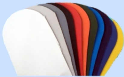
DoubleCoated PVC-tex druge barve po RAL +10%

1. menjava tubusov - v treh cenovnih razredih :